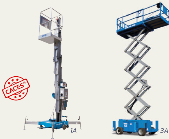
Précédemment catégories 1A et 3A